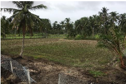
Nach dem Landkauf im Mai 2017