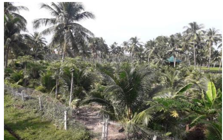
Die Plantage im Mai 2019