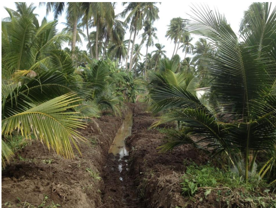
Die Plantage mit Drainagegräben

Die Aufbauphase ist schon bald in der Halbzeit. Wir kommen unserem Ziel näher, Menschen mit Behinderungen diverse Aktivitäten anzubieten. Die Vision nimmt deutlich Gestalt an.