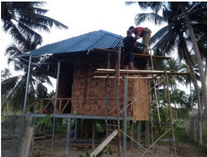
Bau des Bungalows

Der Bau Restaurants und des Bungalows Ende 2017 war innert weniger Monaten abgeschlossen. Diese geben der Plantage nun Farm-Strukturen. Es ist bemerkenswert, welche Form alles angenommen hat.