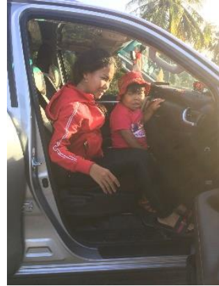
Taxitransport zum Farmrestaurant

Die Eltern der Kinder mit Behinderung wurden zum zukünftigen Engagement von Coconutgarden befragt.