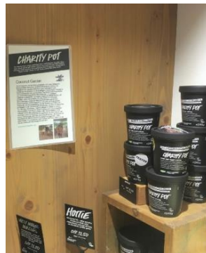
Projektbeschreibung mit Produkt bei LUSH